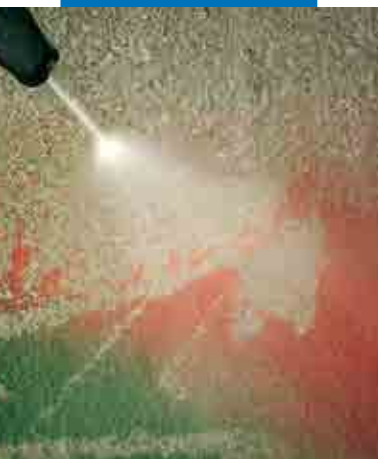
Bruk av høytrykkspyler på betong, behandlet med WallGard Graffiti Barrier

OBS: Graffiti skal fjernes fra overflater som er behandlet med WallGard Graffiti Barrier , ved hjelp av en høytrykkspyler og vann som holder + 80°C. Vi anbefaler på forhånd å sikre at underlaget tåler den fysiske-mekaniske belastningen.