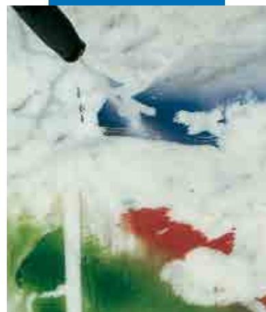
Bruk av høytrykkspyler på Carrara-marmor, behandlet med WallGard Graffiti Barrier

VOC innhold i bruksklare produkter (EU direktiv 2004/42/EC) (g/l): ≤ 15