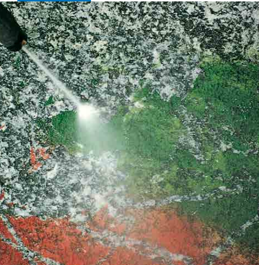
Bruk av høytrykkspyler på granitt, behandlet med WallGard Graffiti Barrier